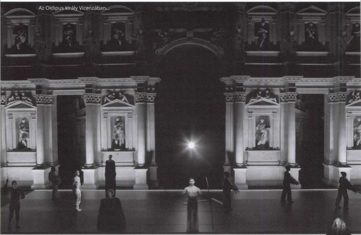
Az Oidipus király Vicenzában...

Komoly csapdák leselkednek arra, aki a görög színház megismerésére és megértésére vállalkozik. A színháztörténet elmúlt kétezer-ötszáz éve azt mutatja, hogy sokan nem is tudták el-