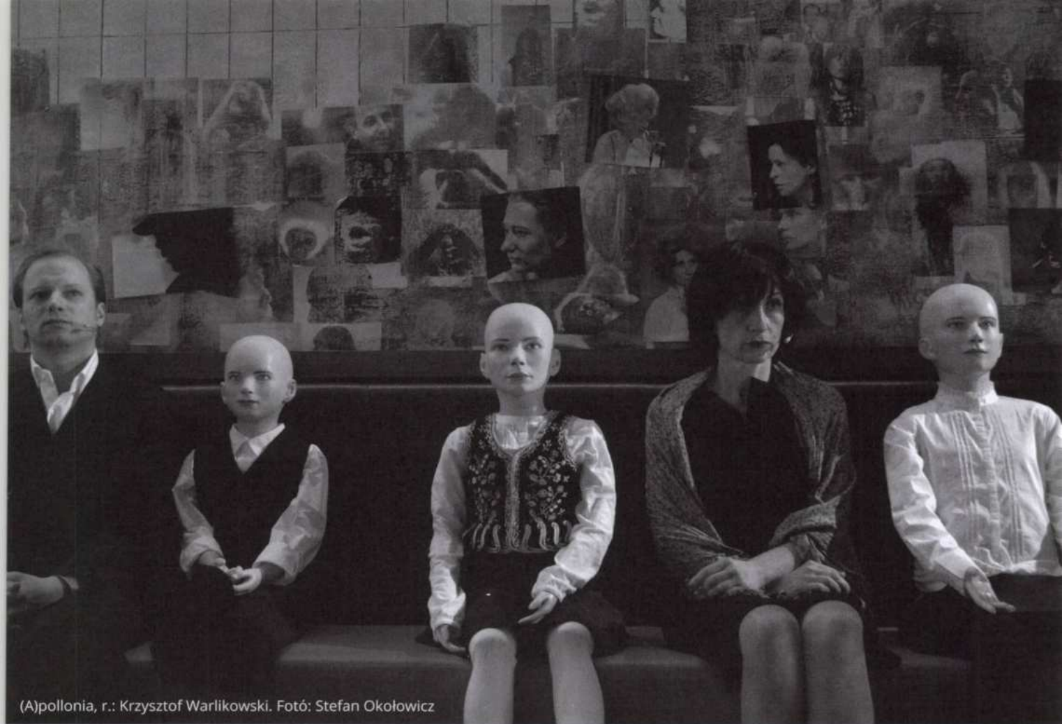
(A)pollonia, r.: Krzysztof Warlikowski.